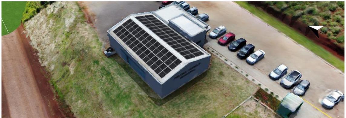
Figura 1: Esquema da montagem das placas sobre a cobertura

O Município de Coqueiros do Sul possui projeto de instalação de sistemas de energia solar em alguns prédios de sua propriedade.