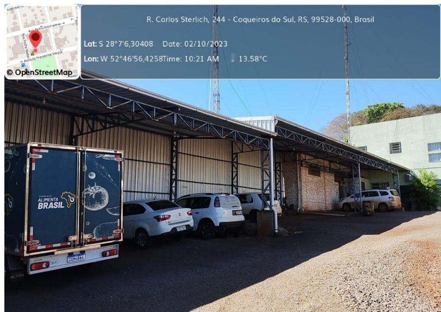
Figura 2: Estrutura do abrigo de veículos