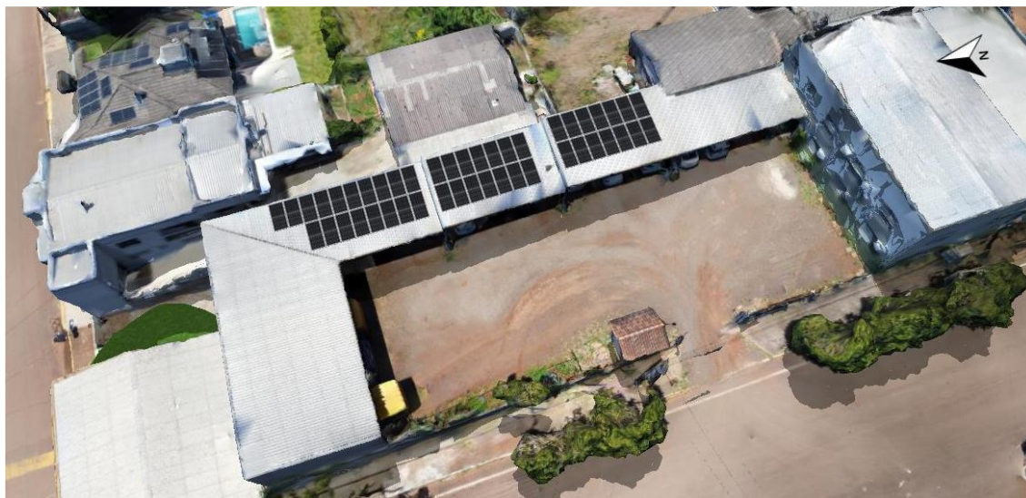
Figura 1: Esquema da montagem das placas sobre a cobertura

O Município de Coqueiros do Sul possui projeto de instalação de sistemas de energia solar em alguns prédios de sua propriedade.