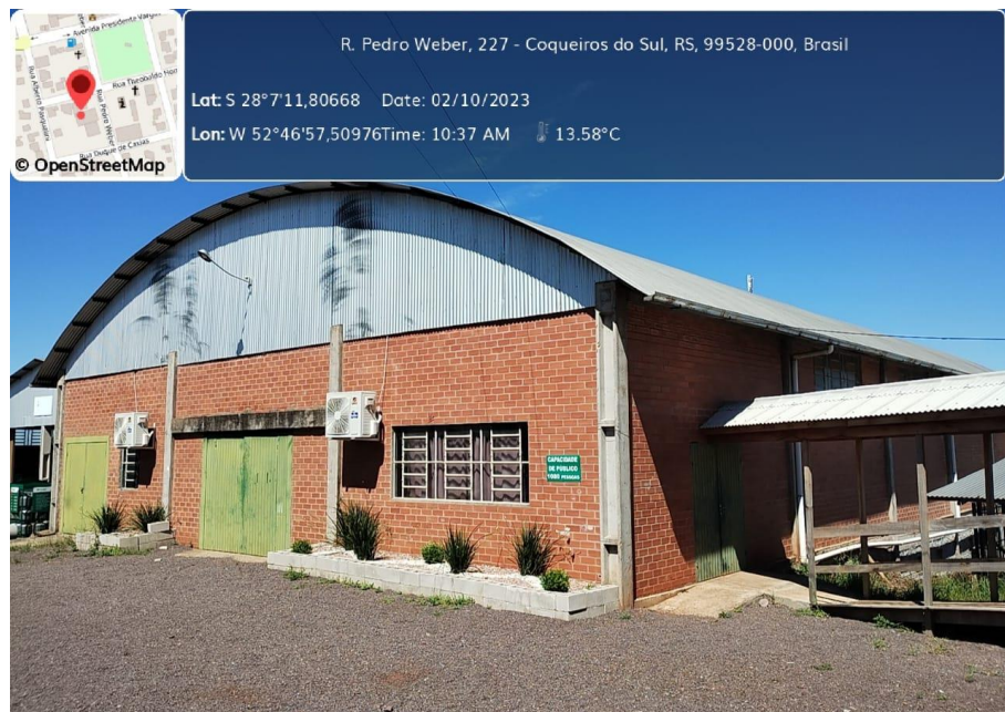
Figura 2: Estrutura do pavilhão