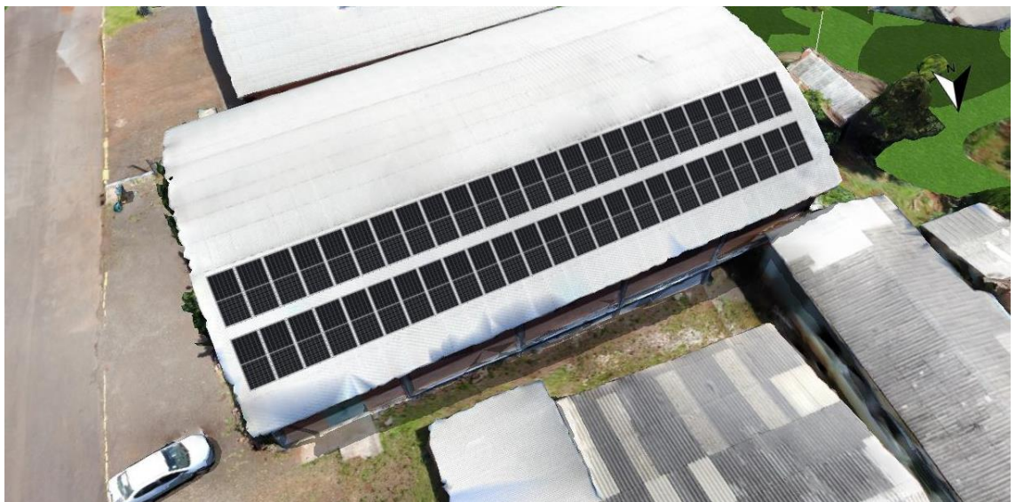
Figura 1: Esquema da montagem das placas sobre a cobertura

O Município de Coqueiros do Sul possui projeto de instalação de sistemas de energia solar em alguns prédios de sua propriedade.